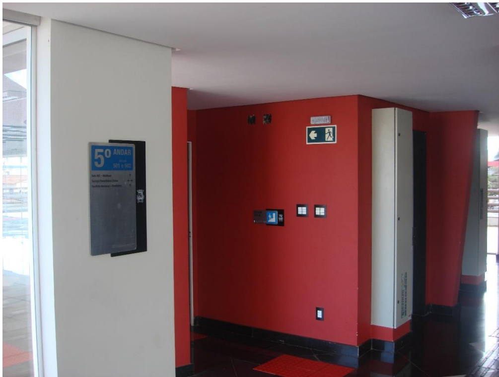
Saguão do elevador