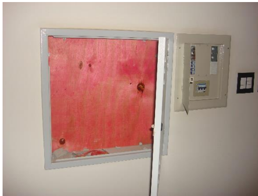
Quadro de força