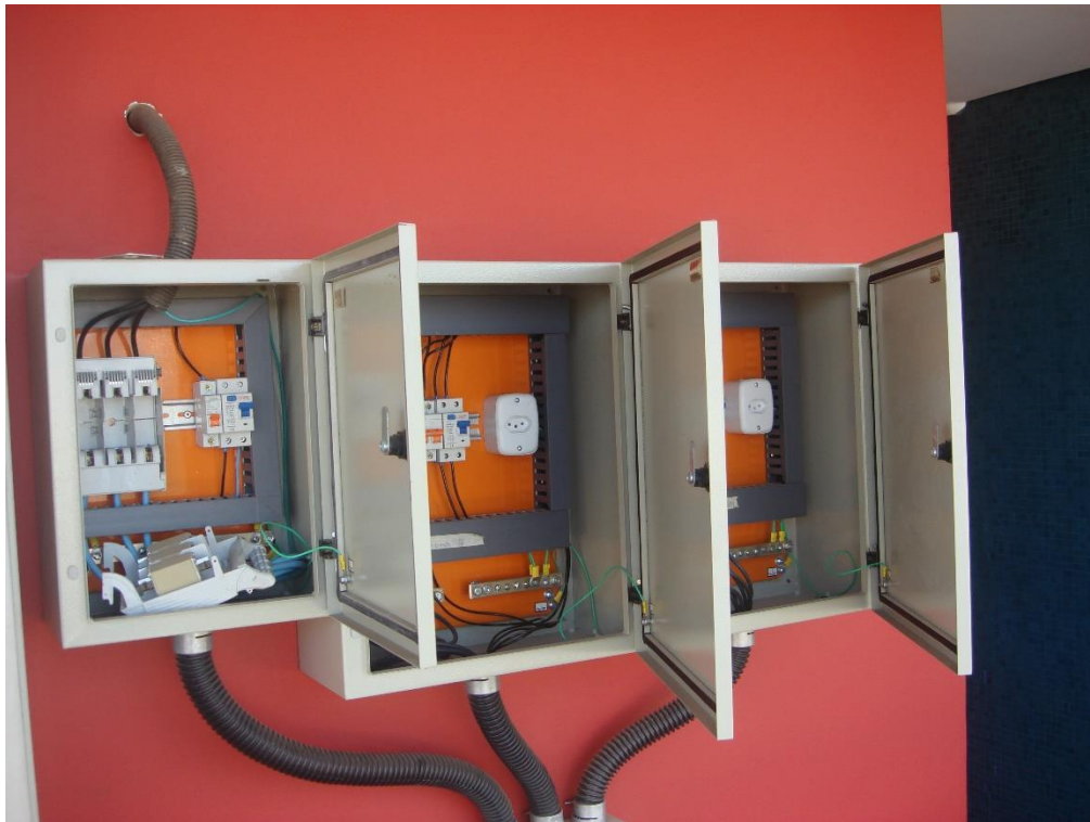
Quadros de Comando dos elevadores