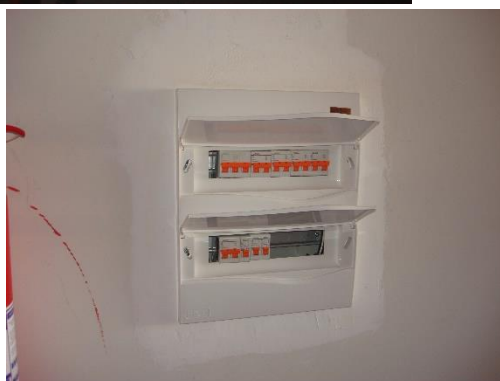
Quadro de iluminação