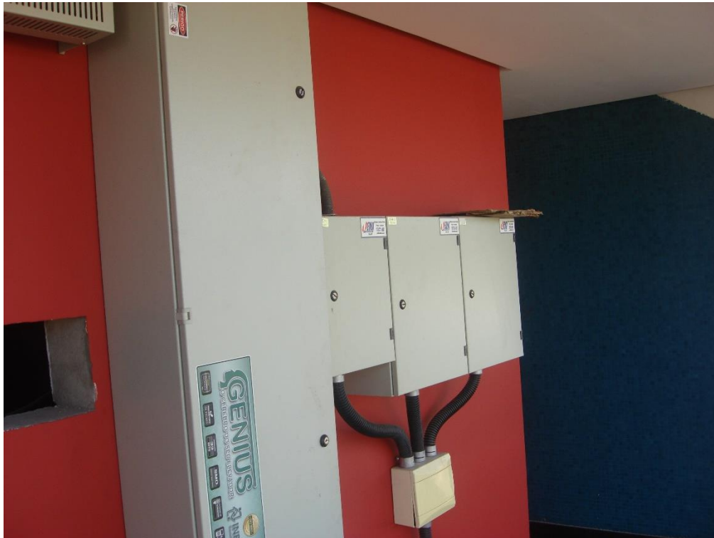
Quadros de Comando dos elevadores