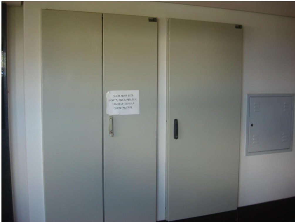
Quadro Geral – Plenário