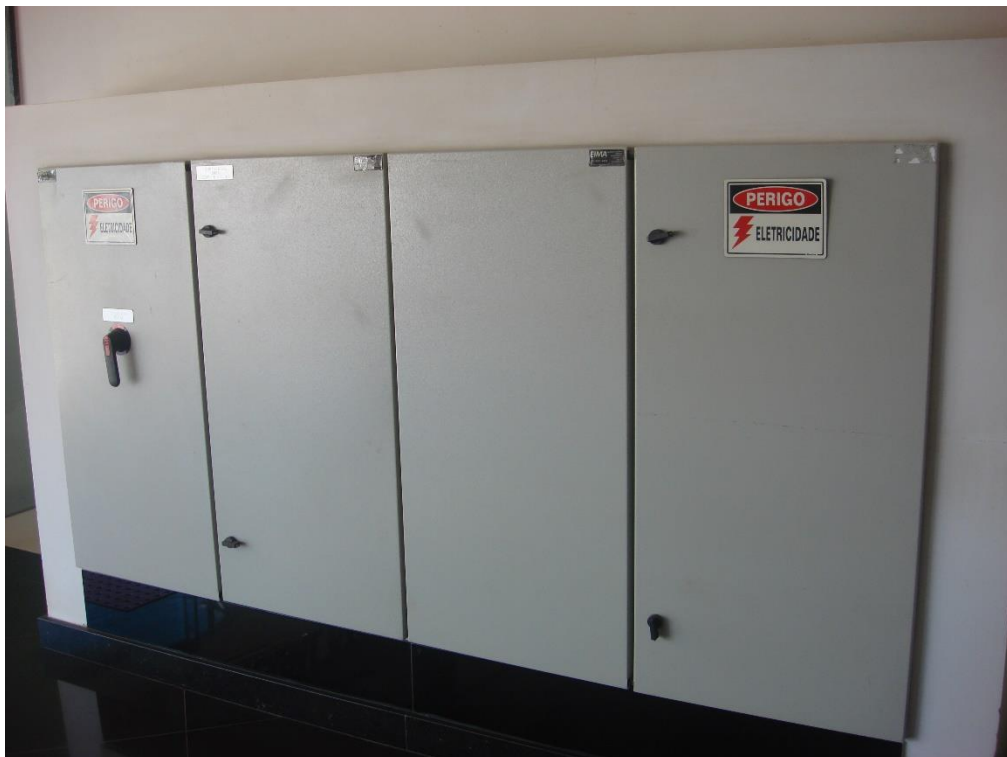
Quadro Geral do Prédio