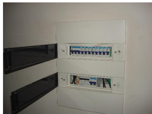
Quadros na Circulação oval – Iluminação e força