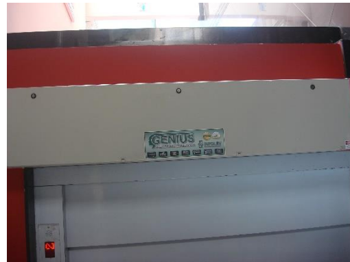
Quadros de Comando dos elevadores