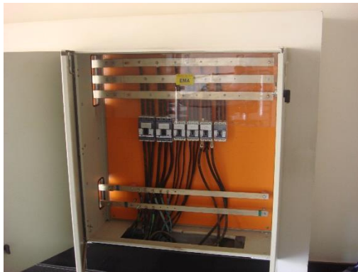
Disjuntores e barramentos