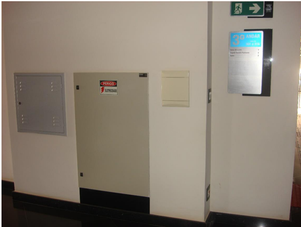
Saguão dos elevadores