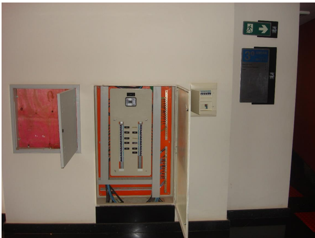
Quadros Geral, de Iluminação e força