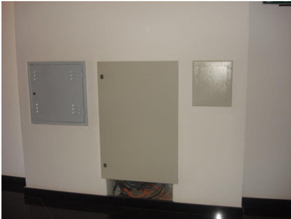
Quadro geral de Distribuição