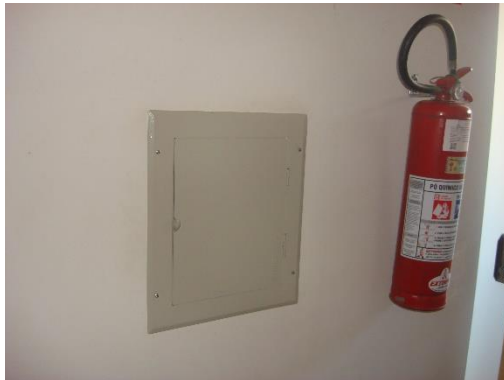
Quadro de Força