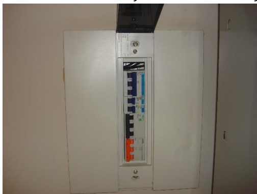
Quadro de Iluminação