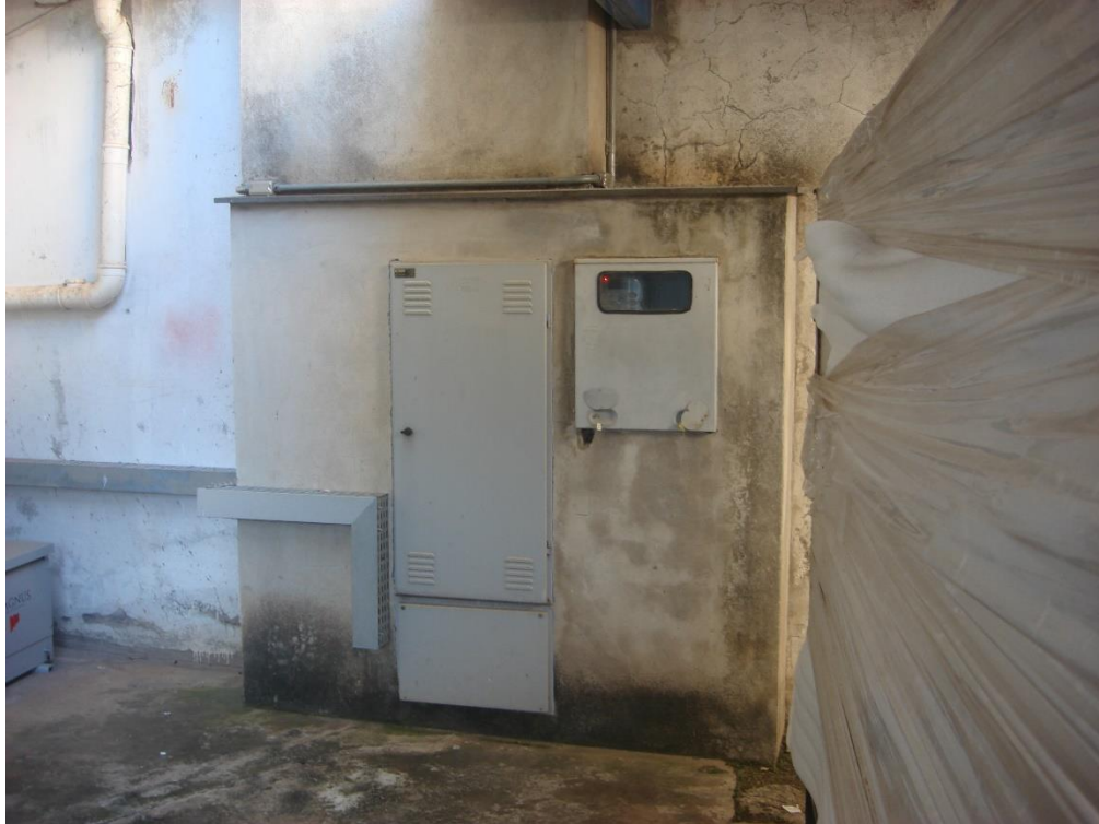
Disjuntor Geral da CEMIG