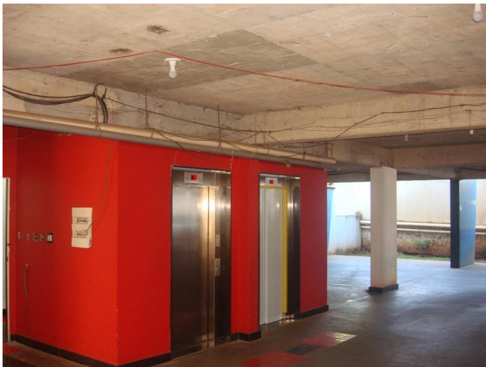
Saguão dos elevadores