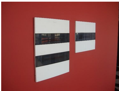
Iluminação salões de eventos