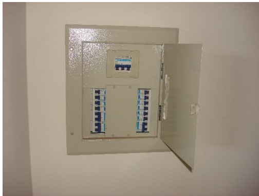
Quadros Iluminação e força