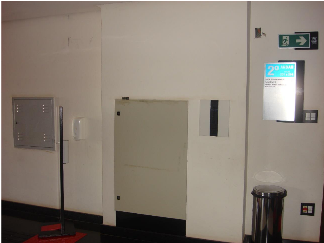
Saguão dos elevadores